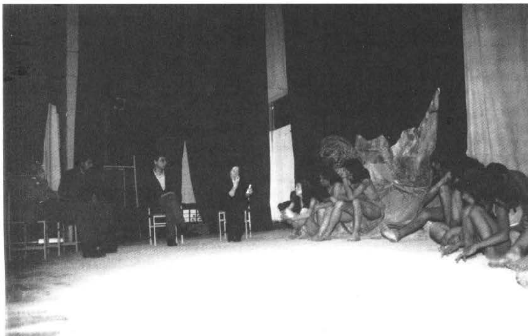
Taller N° 1, I Región, Iquique-Arica. Acción de seguimiento.