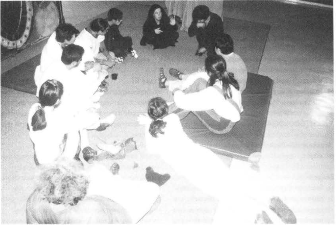
Seguimiento y evaluación, grupo No Más, Iquique.

4. Diseño integral: entendido como el conjunto de signos escénicos que apoyan la materialización del espacio teatral, es decir, escenografía, vestuario, utilería, iluminación, máscaras, maquillaje y musicalización.