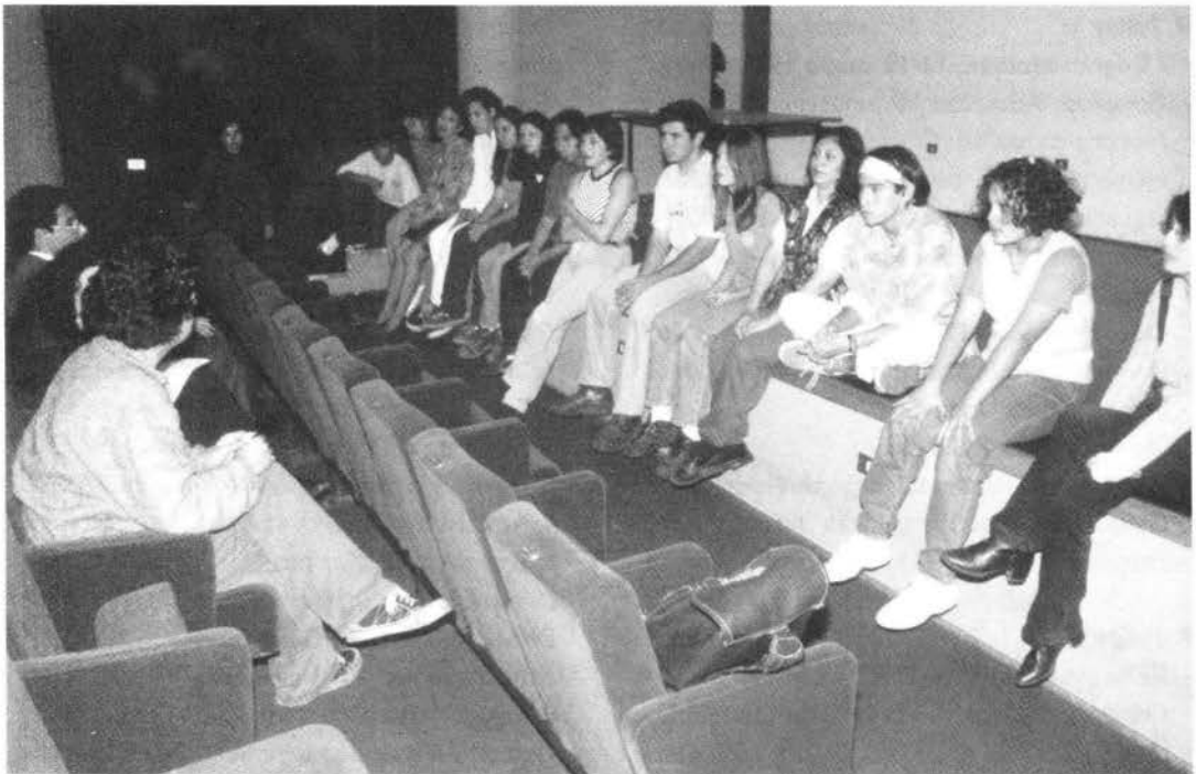
Taller N° 1, I Región, Iquique-Arica. Sesión de evaluación.

Por ello, actuaremos con un nuevo concepto: el de evaluación/valoración, que combina aspectos cognitivos y afectivos de la acción que pretendemos impulsar.