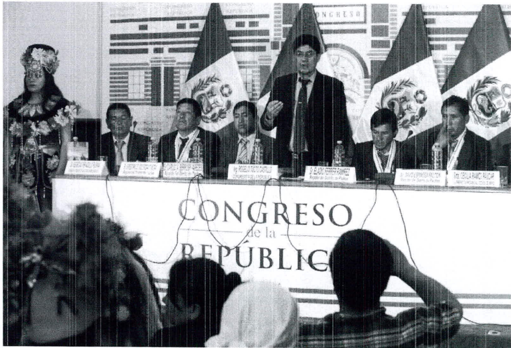
Evento realizado en el Congreso sobre la fiesta preinca "Shumaq Nunash"