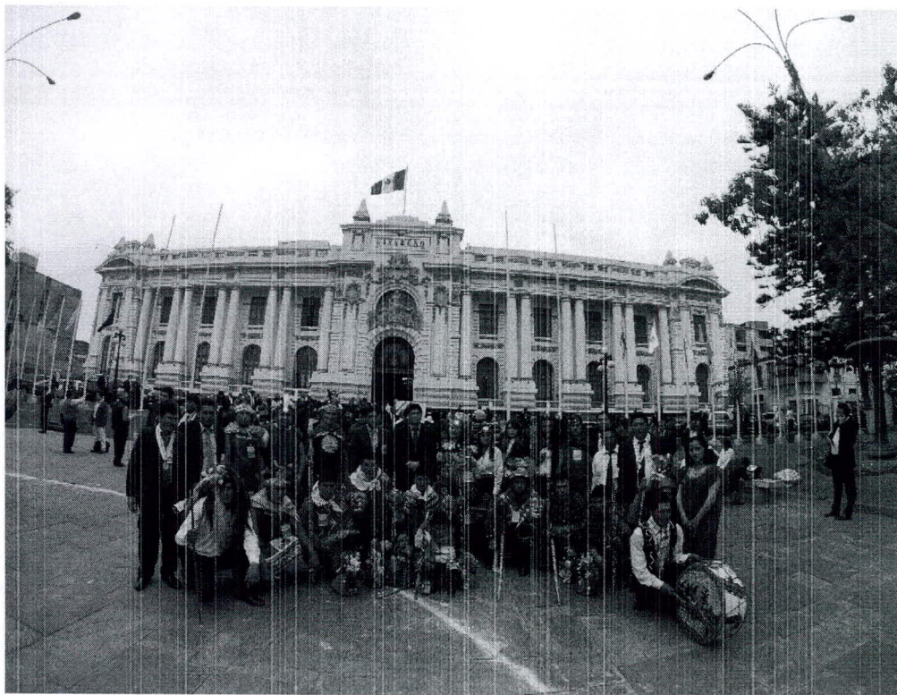
Evento realizado en el Congreso sobre la fiesta preinca "Shumaq Nunash"